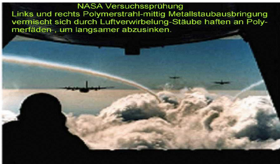
NASA aircraft conduct an atmospheric spraying exercise

Mehr unter: www.chemtrails-info.de/ - www.bfed.se - www.bfed.dk - www.bfed.net - www.zdd.dk - http://www.winion.org/navi/download.html http://www.winion.org/navi/dvd.html